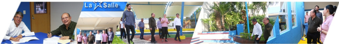
FIRMA DE CONVENIO LA SALLE.