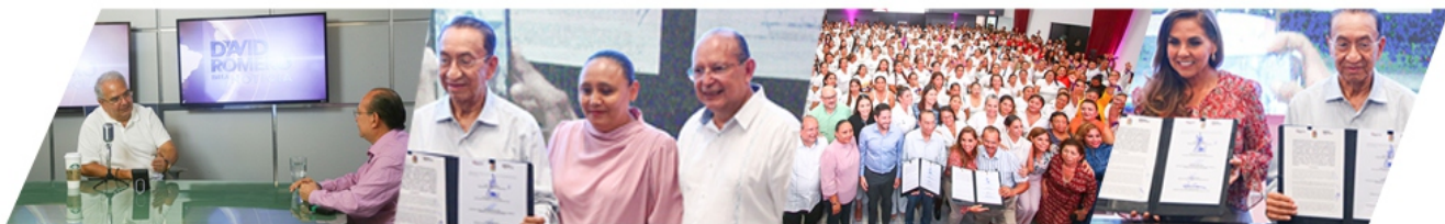
FIRMA DE CONVENIO POR UN QUINTANA ROO SEGURO.