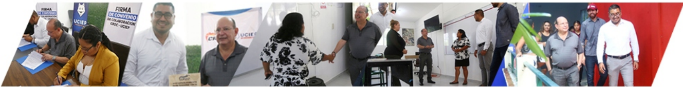
FIRMA DE CONVENIO UCIEP.