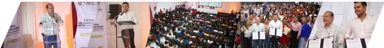
FIRMA DE CONVENIO CON LA SECRETARIA DEL BIENESTAR.