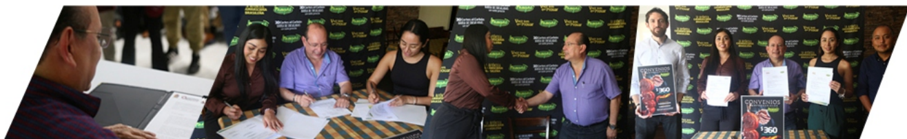
FIRMA DE CONVENIO CON PAMPAS