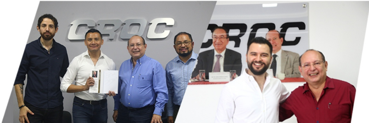
REUNIÓN CON EL DIPUTADO FEDERAL ALBERTO BATUN