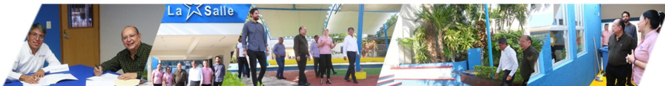
FIRMA DE CONVENIO LA SALLE.