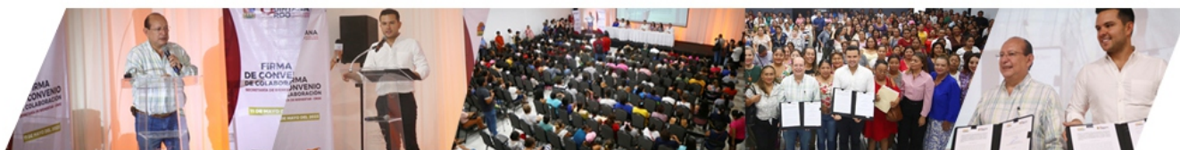
FIRMA DE CONVENIO CON LA SECRETARIA DEL BIENESTAR.