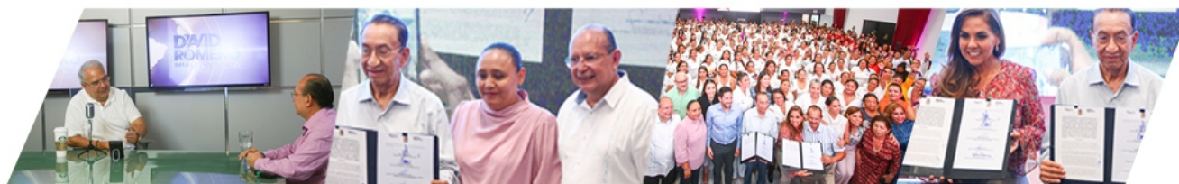
FIRMA DE CONVENIO POR UN QUINTANA ROO SEGURO.