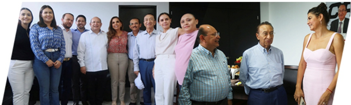
REUNIÓN CON LA GOBERNADORA LIC. MARA LEZAMA ESPINOSA