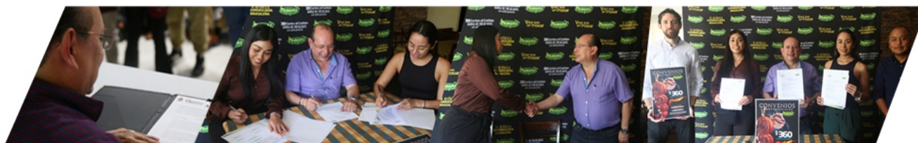
FIRMA DE CONVENIO CON PAMPAS