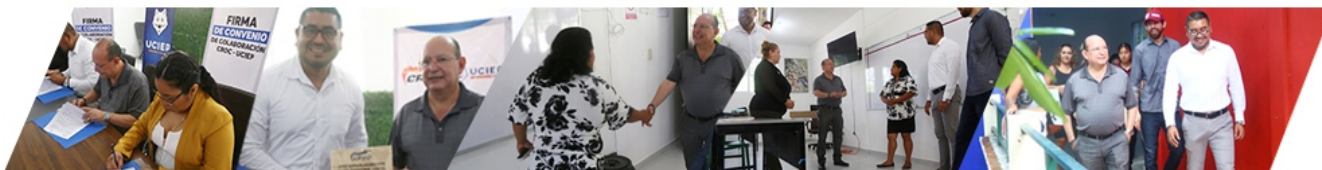
FIRMA DE CONVENIO UCIEP.