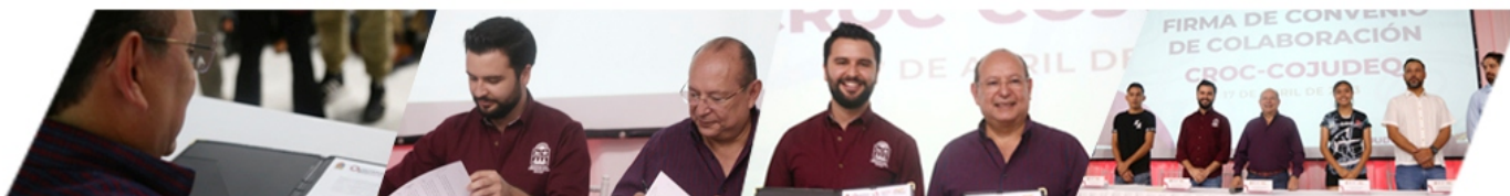
FIRMA DE CONVENIO CON LA COJUDEQ